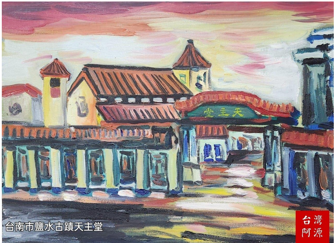
台南市鹽水古蹟天主堂