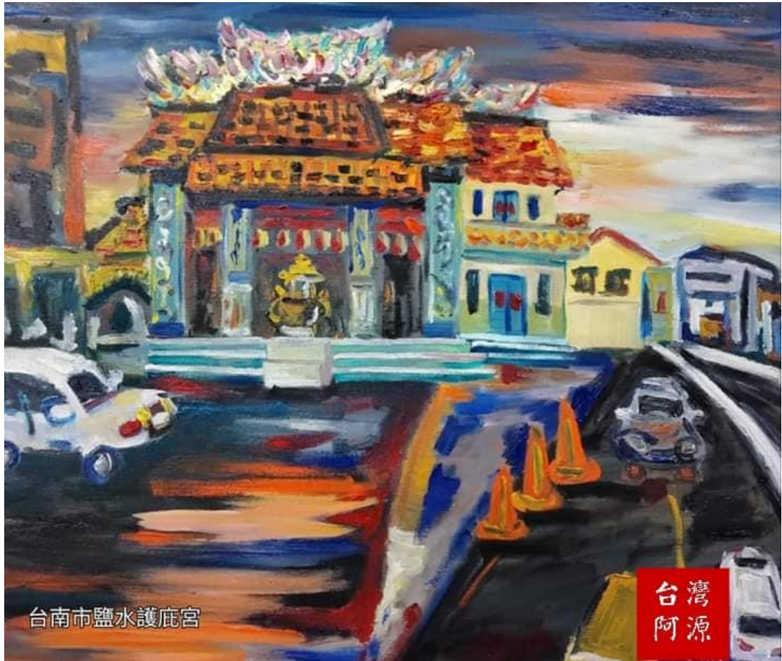
台南市鹽水護庇宮